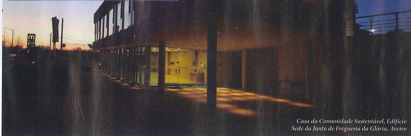
Casa da Comunidade Sustentável, Edifício Sede da Junta de Freguesia da Glória, Aveiro

No mês em que comemora o seu 32º aniversário, a empresa sediada em Anadia tem um percurso centrado na construção de obras públicas. A estratégia de futuro é inverter este cenário e apostar nas obras privadas, com a qualidade que caracteriza a sua atuação.